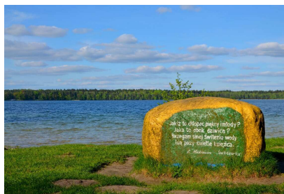
Kamień z cytatem z ballady

Powiększcie sobie i bez problemu zobaczycie.